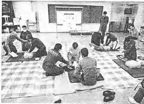
3月18日に西東京消防署で開催、会員18名参加