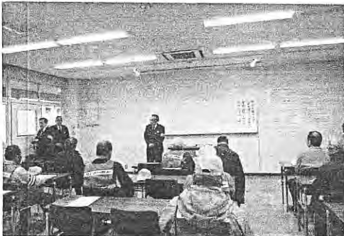
3月25日に田無自動車教習所で開催され、17名が出席